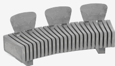
VERTEBRA CURVO R UM323R