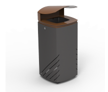
Mielek T PA691S