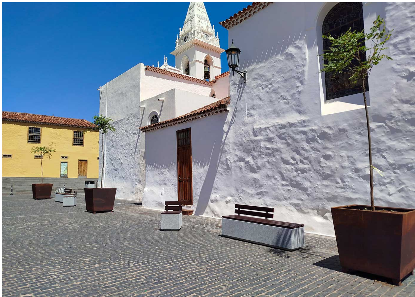
Kube Plus UM372LP

Renovación de la plaza de la iglesia de Los Silos con bancos y sillas Kube Plus, jardineras NER y pilonas Trajana, integrando diseño resistente en un entorno histórico.